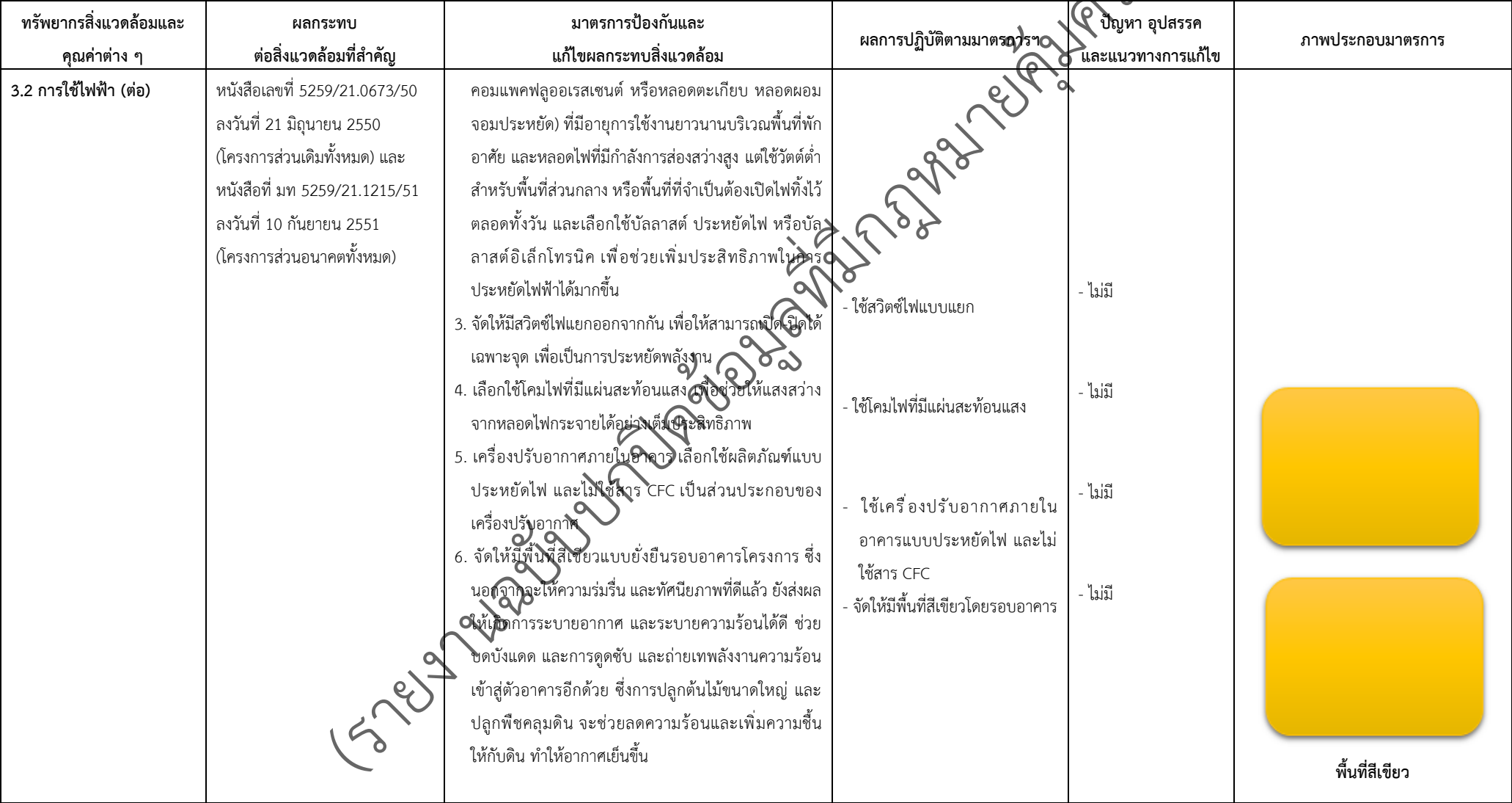
ตารางที่ 2-1 ผลการปฏิบัติตามมาตรการป้องกันและแก้ไขผลกระทบสิ่งแวดล้อมและมาตรการตรวจสอบผลกระทบสิ่งแวดล้อม (ระยะดำเนินการ) โครงการจัดสรรที่ดิน เพอร์เฟค มาสเตอร์พีช รัตนาธิเบศร์ (โครงการต่อเนื่องส่วนอนาคต) (ต่อ)