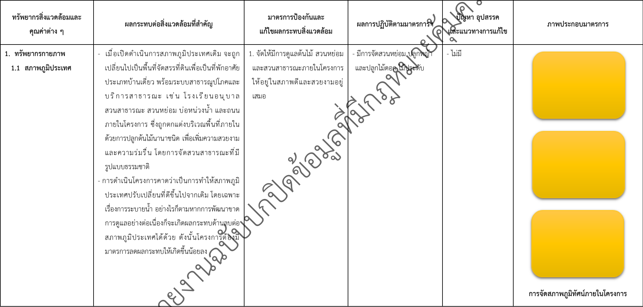
ตารางที่ 2-1 ผลการปฏิบัติตามมาตรการป้องกันและแก้ไขผลกระทบสิ่งแวดล้อมและมาตรการตรวจสอบผลกระทบสิ่งแวดล้อม (ระยะดำเนินการ) โครงการจัดสรรที่ดิน เพอร์เฟค มาสเตอร์พีช รัตนาธิเบศร์ (โครงการต่อเนื่องส่วนอนาคต)